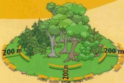
Zone exposée aux incendies

La présente réglementation découle d'un arrêté préfectoral 2 et s'applique à tout le département , au sein des zones exposées aux incendies (bois, forêts, plantations et résidus de cultures) et terrains situés à moins de 200m de ceux-ci .