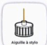
Aiguille à stylo