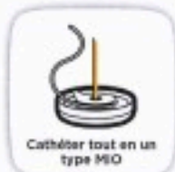
Cathéter tout en un type MIO