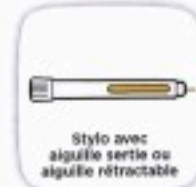
Stylo avec aiguille sertie ou aiguille rétractable