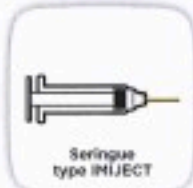
Seringue type INJECT

Les déchets d'activités de soins à risques infectieux (ou DASRI) regroupent l'ensemble des déchets piquants, coupants, tranchants (aiguilles, lancettes...).