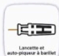
Lancette et auto-piqueur à papillon

Maintenant les DASRI, uniquement en pharmacie !