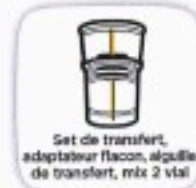
Set de transfert, adaptateur flacon, aiguille de transfert, mix 2 vial