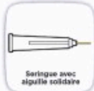
Seringue avec aiguille solidaire