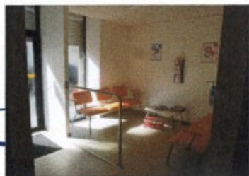
MC - Mise à jour : Février 2021 Version 4