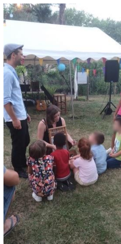
Le groupe Dicilabas a animé la soirée Découverte d'instruments pour certains enfants