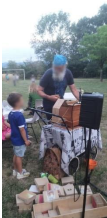
Un habitant d'une de nos communes est venu animer le repas avec un orgue de barbarie.