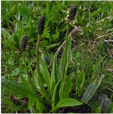
Le plantain , connu pour ses qualités apaisantes sur des piqûres d'insectes ou démangeaisons cutanées.