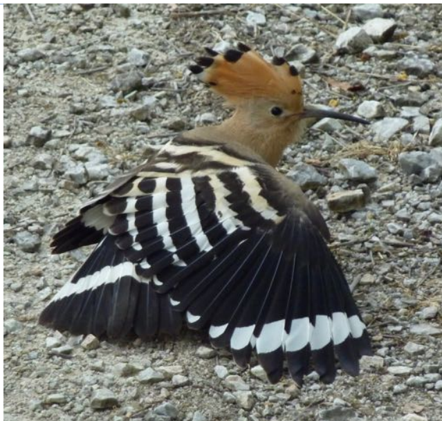
Une huppe , oiseau migrateur. Son chant est facilement reconnaissable « houp, houp, houp »

Il est un autre animal qui met à mal notre biodiversité, c'est le chat. La prolifération des chats dans les zones urbaines a une incidence notable depuis ces dernières années sur la petite faune sauvage (petits rongeurs, passereaux, merles, rouges-gorges...). Pour éviter cela, soyons tous des propriétaires responsables en stérilisant ces animaux pour éviter leur prolifération, en donnant une alimentation variée et riche à ces animaux et aussi en jouant avec eux pour qu'ils ne soient pas tentés de partir à la chasse.