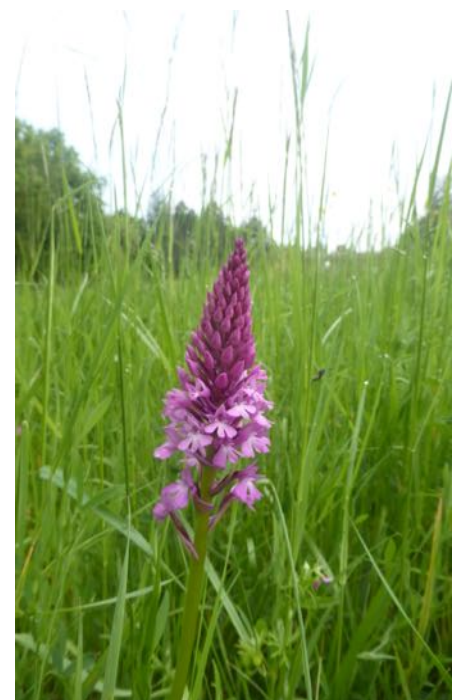
L'orchis pyramidal , polonisé par plusieurs espèces de papillons.