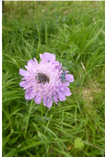
La scabieuse des prés , attire papillons et abeilles.