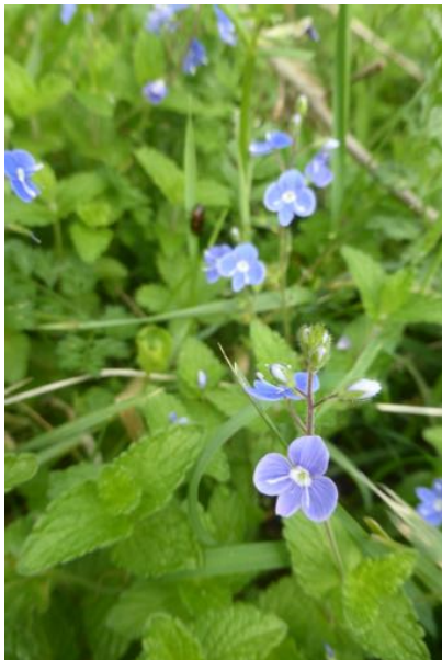
La Véronique des bois , composée de 4 pétales soudés à la base formant la corolle.