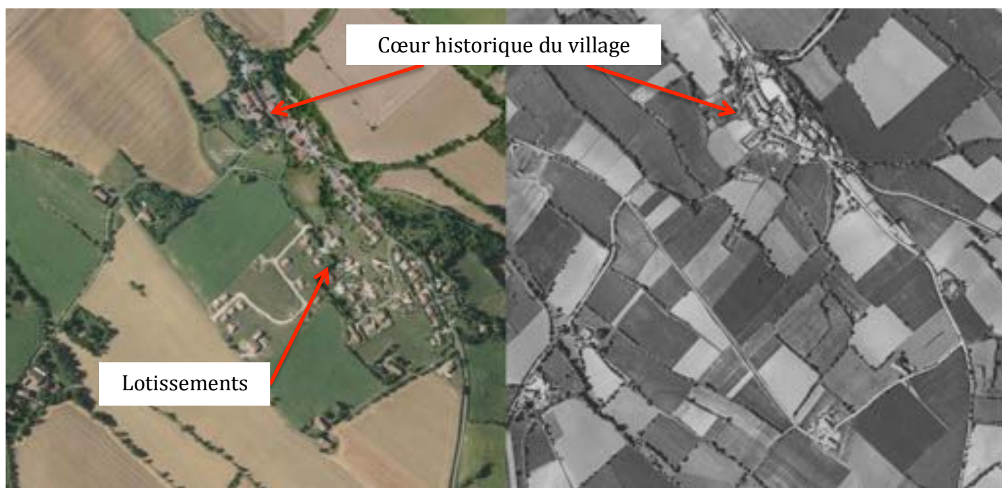
Photo aérienne du village, 2018