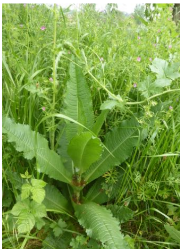
La cardère , les feuilles sont soudées en coupes, l'eau de pluie est retenue par cette coupe d'où un de ses noms vernaculaires : Cabaret-des-oiseaux . La fleur fut jadis utilisée pour carder la laine.