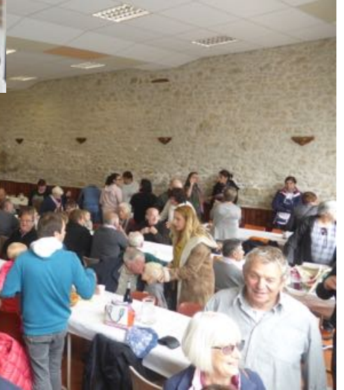
Commémoration au Monument Aux Morts, suivi du repas municipal.