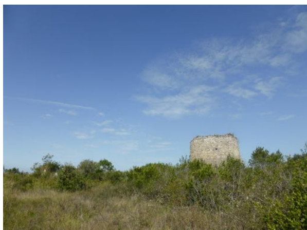
Le Teulel, espace naturel remarquable, situé dans la trame verte.

La partie nord-ouest de la commune et le Peyrencou, cours d'eau le plus important de la commune, sont concernés. De par son relief, le secteur du Teulel est en soi un espace naturel remarquable et a été placé par le SCOT dans la Trame Verte, le Peyrencou, dans la Trame Bleue.