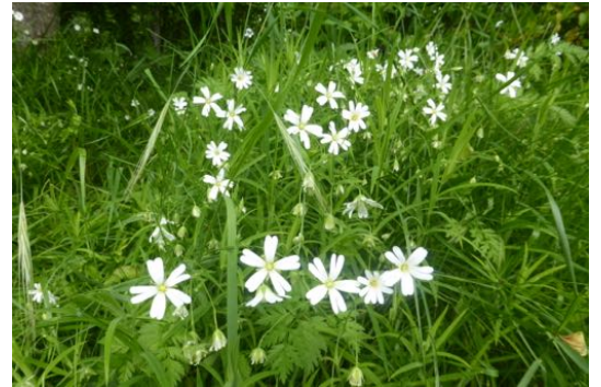
La céraiste des champs , on la rencontre partout en France dans les pâtures, le long des chemins et des haies.