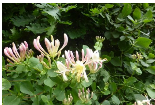
Chèvrefeuille sauvage dans les haies.