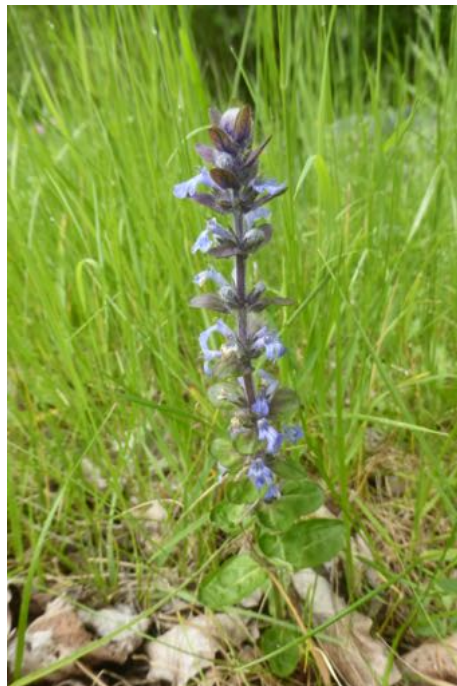
Le bugle rampant ou petite consoude , possède de nombreuses propriétés médicinales (soin des plaies et fractures).