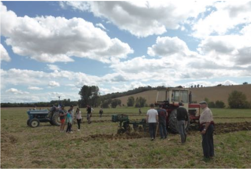
Concours de labours organisé par les jeunes agriculteurs