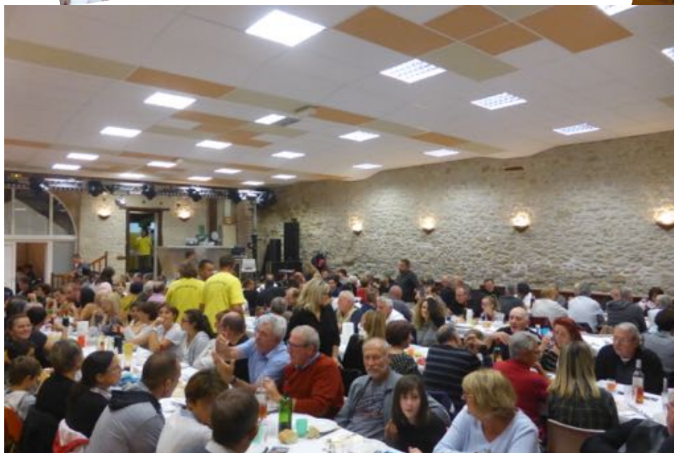
Soirée dîner dansant, au menu « veau à la broche ».