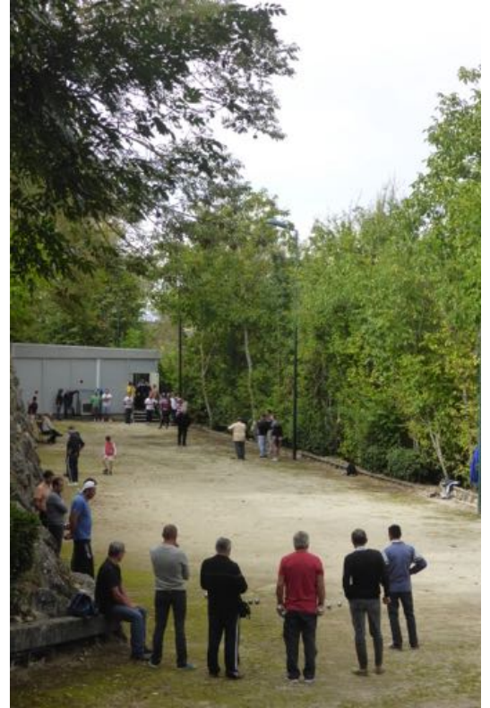
Concours de belote et concours de pétanque