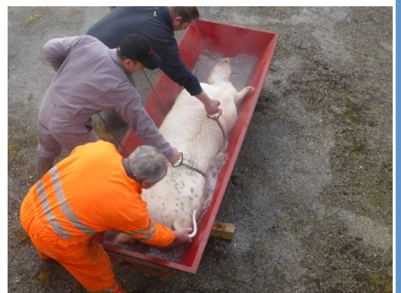
La « pèlère », c'est aussi le nom donné en Gascogne à cette fête traditionnelle.

pour assurer une réussite parfaite à cette journée qui ne ressemble à aucune autre. Car c'est