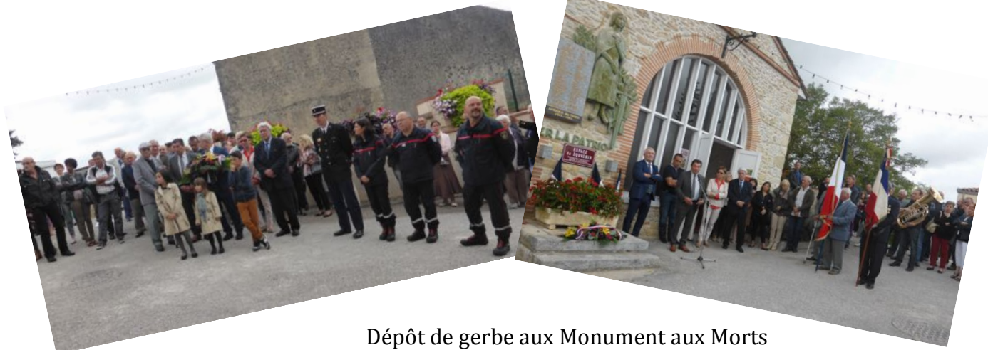
Dépôt de gerbe aux Monument aux Morts