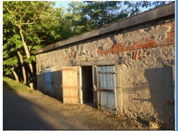
Soies traditionnelles du Lauragais, dans lesquelles les cochons étaient nourris deux fois par jour avec les restes, quelques pommes de terre et céréales.

treuil, tracteur, thermomètre s'invitent