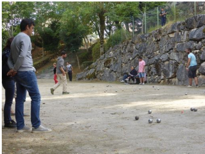
Concours de pétanque