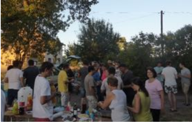
Samedi 24 juin 2017 Animation Feu de la Saint-Jean