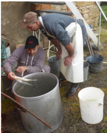
Les experts sont à la tache

Le saindoux n'est peut-être plus revendu pour confectionner des pommades et les boyaux sont maintenant achetés dans les charcuteries mais la quasi totalité de la viande de l'animal (environ 220 kg) est, sur place, découpée, assaisonnée, hachée, transformée, salée et mis à l'abri dans des bocaux ou dans le congélateur familial. Certes désormais dans nos cours de ferme pour ce moment fatidique mais ce sont bien nos grands-mères qui nous ont appris tous ces gestes précis et étonnants qui ont traversés les siècles et qui donnent ces résultats extraordinaires que le monde entier nous envie.